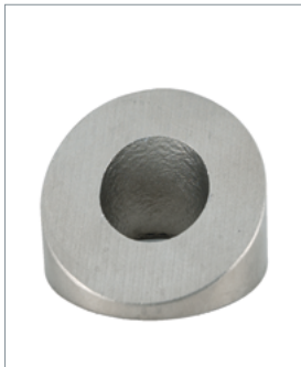
▲ Spezialscheibe zur Schrägumleitung von Kräften