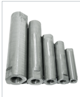
▲ Diverse Spannmuffenausführungen